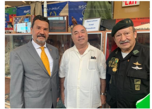
GENERAL RAFAEL REYES MEDAL